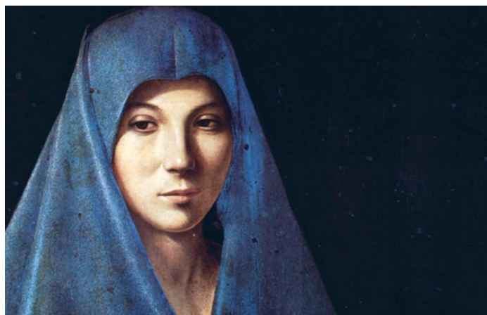
Antonello da Messina „Annunciata di Palermo“, um 1475