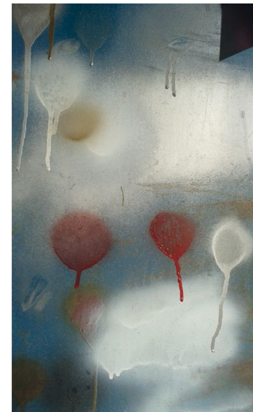
Andrea Roessler, Baumarkt Tbilisi, Mai 2015

Bankverbindung: Konto-Nr. 72 232 184, Sparkasse Bielefeld, BLZ 480 501 61 IBAN: DE66 4805 0161 0072 2321 84, BIC: SPBIDE33XXX