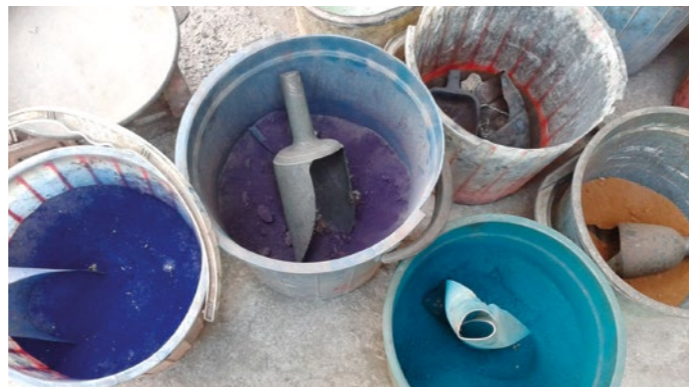
Andrea Roessler, Baumarkt Tbilisi, Mai 2015

Anmeldung: bis 26. November 2015 unter 0521.136 70 93 oder 0157.387 887 06