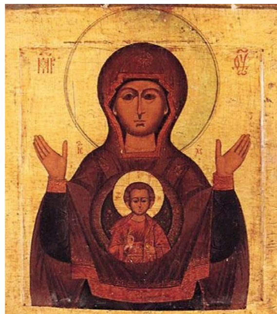
Marienikone, 12 Jh.

Seminaristische Arbeit mit Referaten, künstlerischen Übungen, Kunstbetrachtungen, der Betrachtung eigener biografischer Situationen und Gespräch.